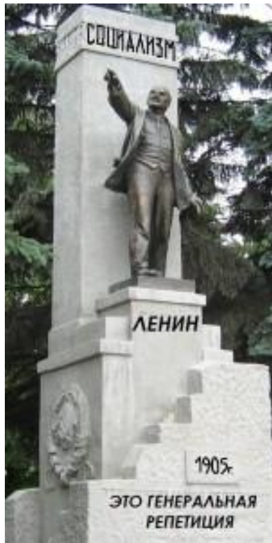
Памятник Ленину 1927 г. напротив школы «Баррикад»

Контрреволюция победила. Но жертвы не были напрасны: накапливался опыт революционной работы. К Октябрю 1917 г. рабочие подошли, имея навыки массовых организованных выступлений, выдвинули надёжных и смелых вожаков — большевиков .