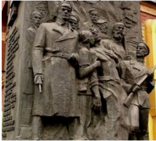
Монумент сормовским рабочим у школы «Баррикад»

12 декабря 1905 г. — весь трудовой Нижний бастовал, не работал даже транспорт, люди вышли на улицы. Из рук в руки переходила листовка «Пробил час», до смерти напуганный губернатор зывал Москву о помощи: вышлите срочно войска! Сормовичи приступили к сооружению баррикады возле красного кирпичного здания школы (теперь это школа Баррикад на ул. Коминтерна) из телеграфных столбов, ящиков, дров, снега и льда. В самой школе расположился штаб восстания. Прибыли войска, вызванные губернатором.